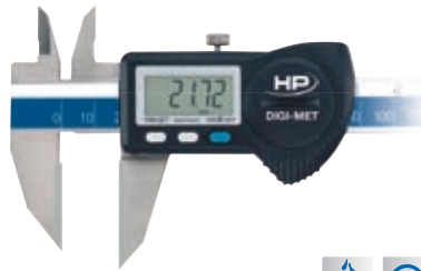
Anreiss-Messschieber 1226 912