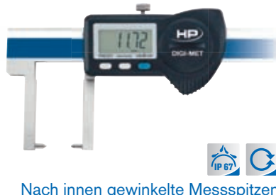
Nach innen gewinkelte Messspitzen 1226 904