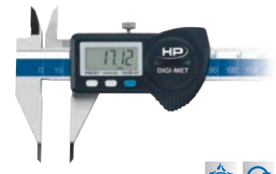
Spitze Messschenkel 1226 922