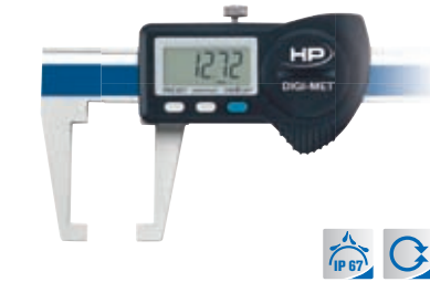
Nach innen gewinkelte Messschnäbel 1226 908