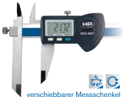
verschiebbarer Messschenkel 1226 928