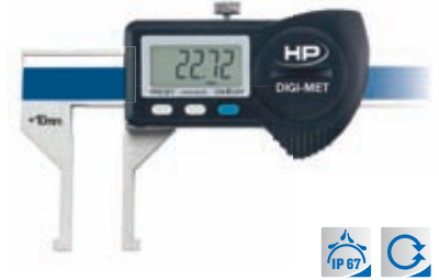
Nach aussen gewinkelte Messschnäbel 1226 910