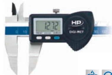
Wellennutenmessschieber 1226 920