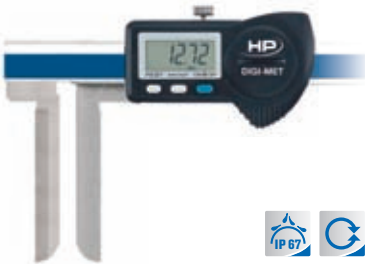
Lange, schmale Schenkel 1226 930