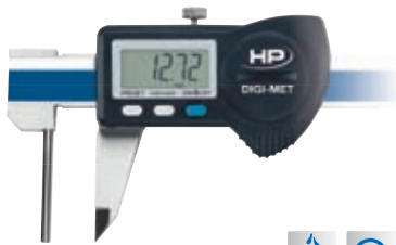
Wandstärkenmessschieber 1226 918