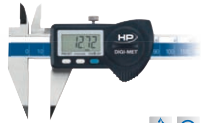
Spitzenmessschieber 1226 916