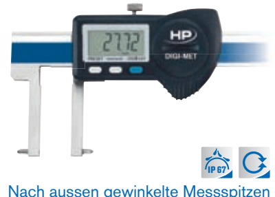
Nach aussen gewinkelte Messspitzen 1226 906